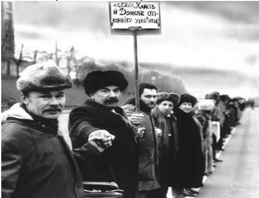
Живий ланцюг на день злуки, 1990 рік

Народження вільної України. 16 липня 1990 року під тиском опозиції та масових продемократичних вуличних демонстрацій Верховна Рада УРСР ухвалила Декларацію про державний суверенітет України. Це стало можливим на тлі економічного занепаду Радянського Союзу, а також завдяки політиці "гласності" та "перестройки", які давали можливість українцям висловлювати думки щодо самотності своєї нації.