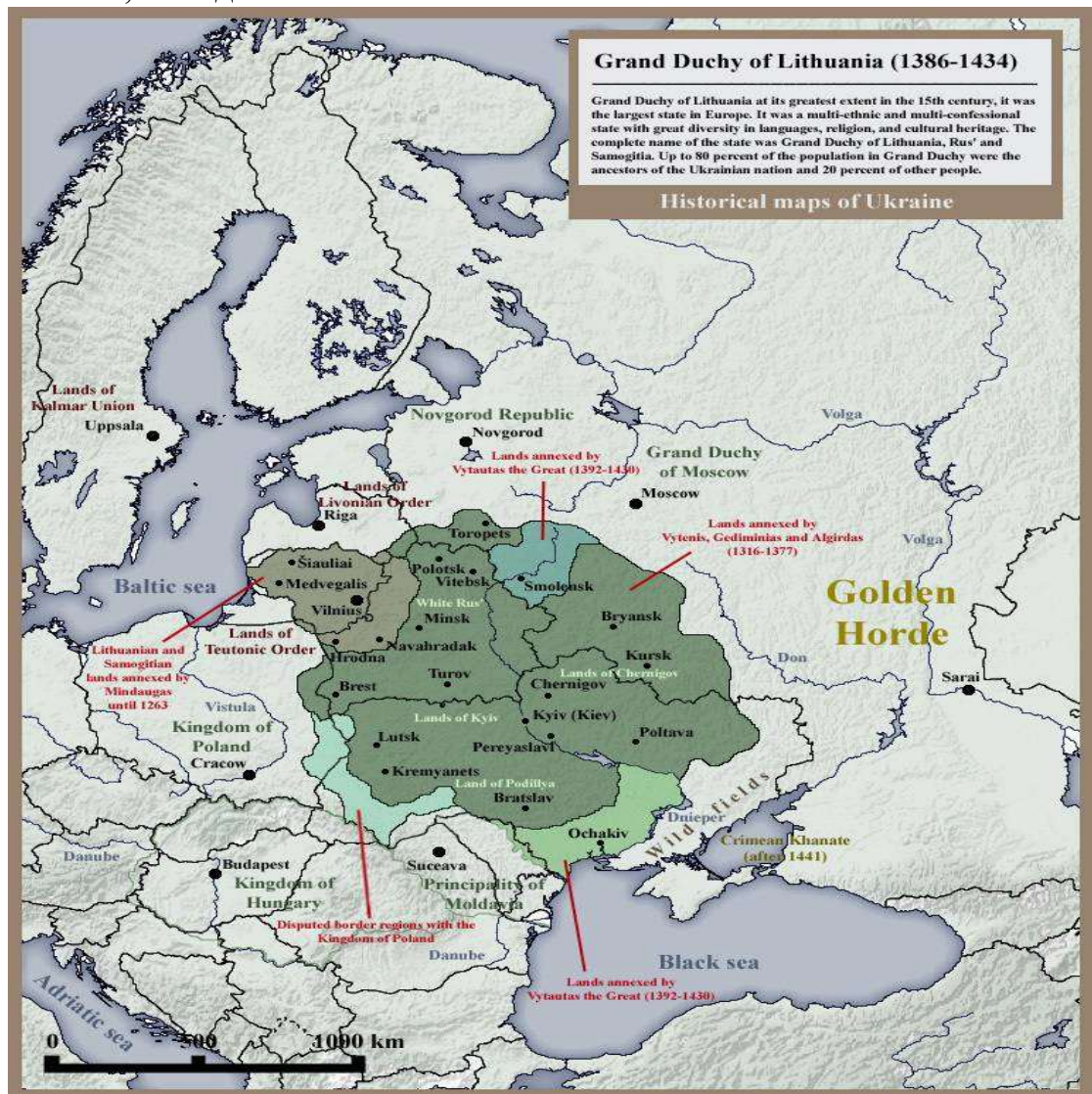
Велике князівство Литовське, 1434 рік

З припиненням існування Галицько-Волинської держави у середині XIV століття , території сучасної України опинилися повністю розділеними між Золотою Ордою, Королівством Польським та Великим Князівством Литовським, а згодом й між Річчю Посполитою та Московією.