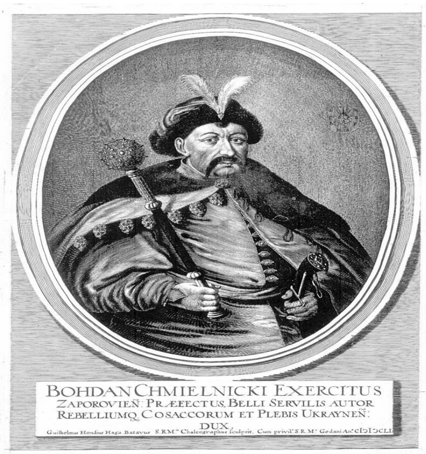
Портрет Богдана Хмельницького

Спершу Хмельницький боровся за автономію українського народу, але зі зміною короля бажав повністю звільнити українські території з-під контролю Речі Посполитою "з лядської неволі... народ увесь руський... по Львів, Холм і Галич".