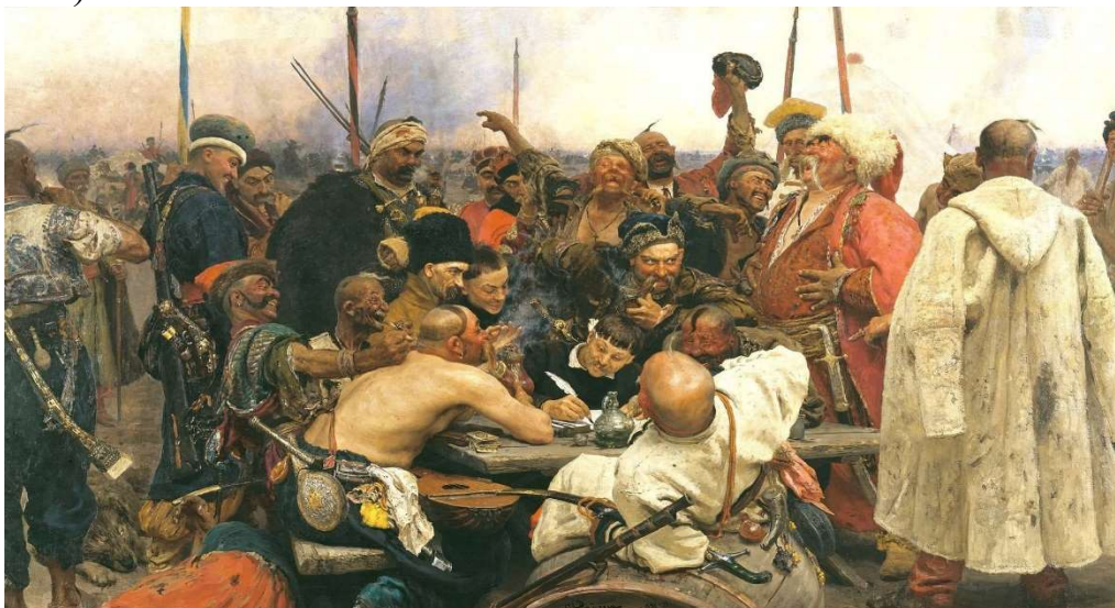
"Запорожці пишуть листа турецькому султану", Ілля Рєпін, 1880 рік

містечка – січі. Такі селяни називали себе козаками (з тюркської – "вільна людина").