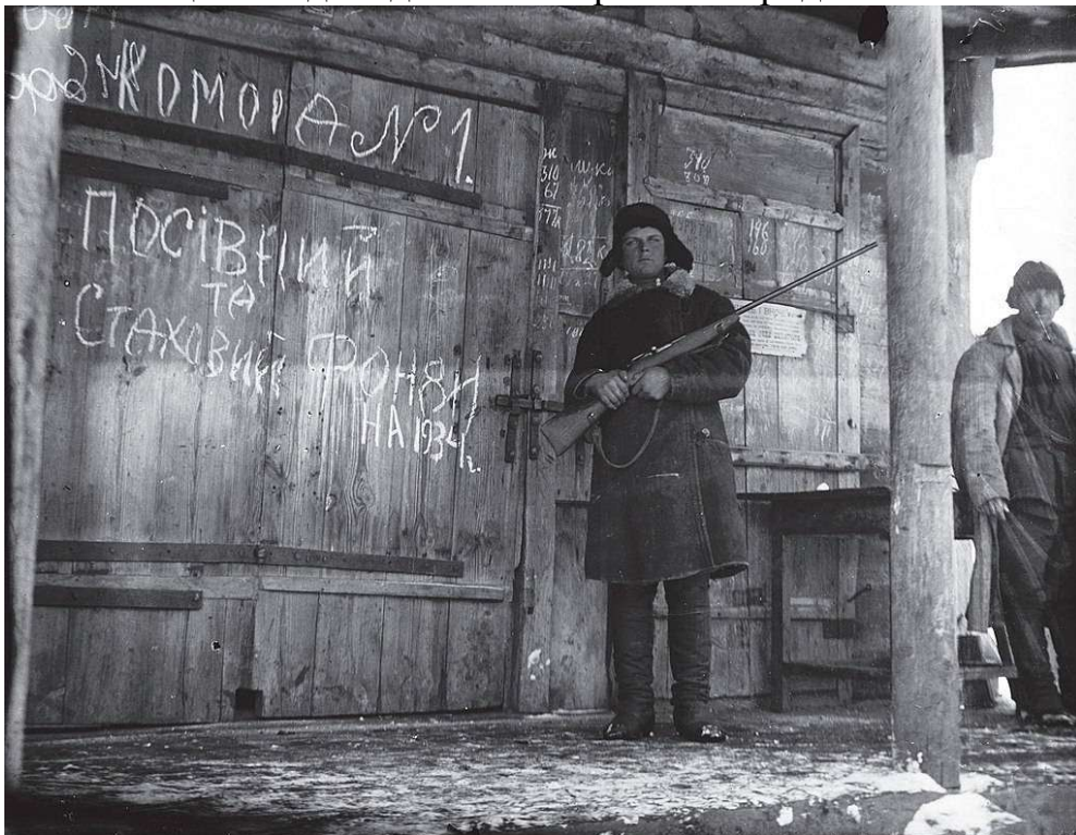
Комсомолец охороняє відібране в селян зерно

В міру того як тоталітарна радянська влада намагалася притиснути бажання українців до самовизначення, наростав рух спротиву, який розвивався у формі збройної боротьби впродовж 1920-1950-х років, а також як ненасильницька та дисидентська боротьба впродовж 1960-1980-х років.