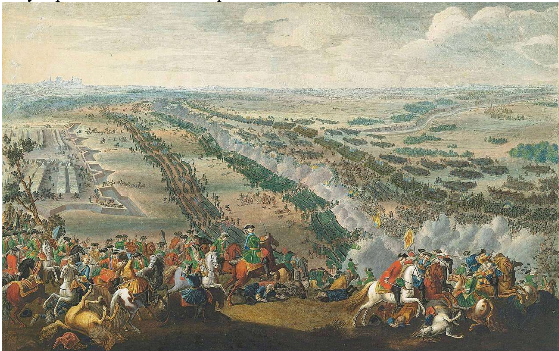
Битва під Полтавою

Згідно з Прутським миром та Адріанопольською угодою Московська держава відмовлялась від претензій на Правобережну Україну, визнавала турецьку юрисдикцію над Запоріжжям.